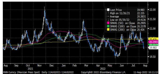
Figura 3. Desempeño del peso (últimos 12 meses)