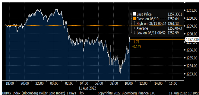
Figura 2. Índice ponderado del dólar

Sin embargo, no se puede descartar volatilidad, pues existen factores de riesgo en la economía global que pueden aumentar la demanda por dólares.